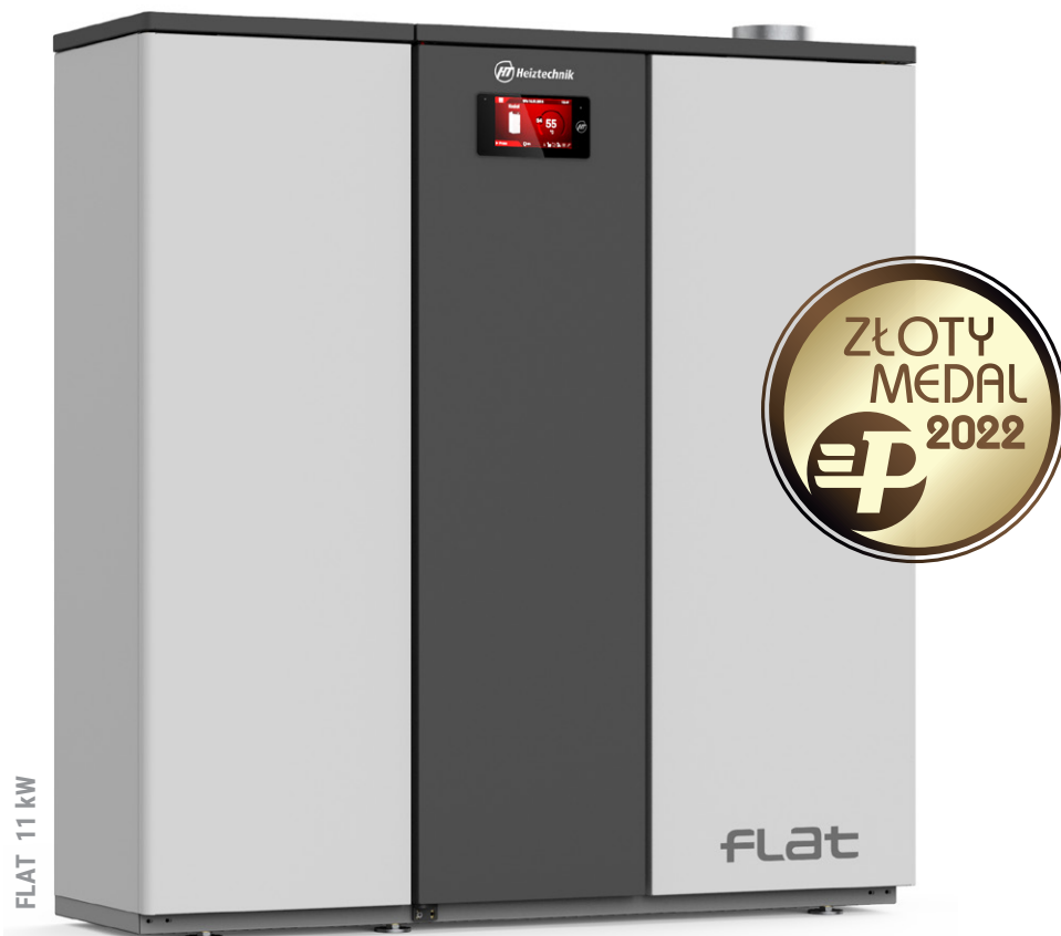
FLAT 11 kW