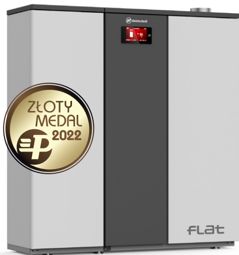
FLAT 11 kW